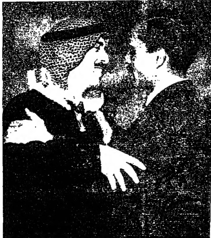
جلالة الملك العظيم يعانق سمو الامير محمد المعظم في مطار عمان امس

AD-DUSTOUR - ARABIC DAILY NEWSPAPER AMMAN SATURDAY 3/2/1968 No: 294